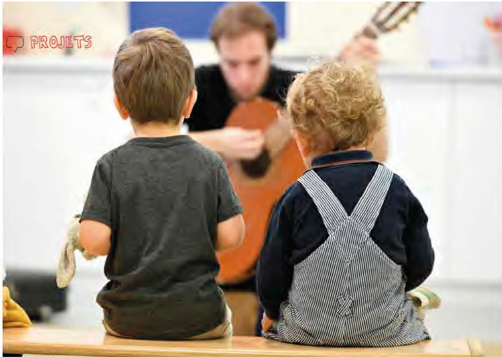
Toi & moi dix doigts

LA LETTRE DES PROFESSIONNELS DU JEUNE PUBLIC